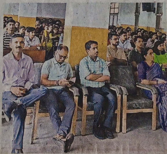
बलिदानो कैप्टन बिक्रम बतरा राजकीय महाविद्यालय पालमपुर में वीरवार को आयोजित दो दिवसीय कार्यक्रम में उपस्थित विद्यार्थी, स्टाफ सदस्य व अन्य