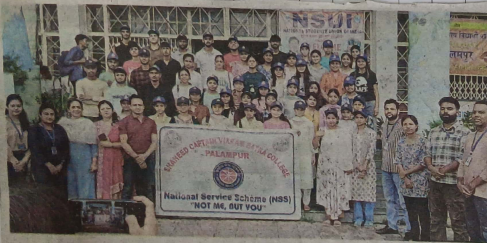
पालमपुर: एन.एस.एस. स्वयंसेवक सामूहिक चित्र में। (भृगु)