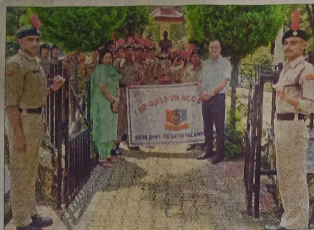
विक्रम बत्रा कॉलेज में श्रद्धांजलि देते कॉलेज प्राचार्य, स्टाफ और एनसीसी कैडेट्स।