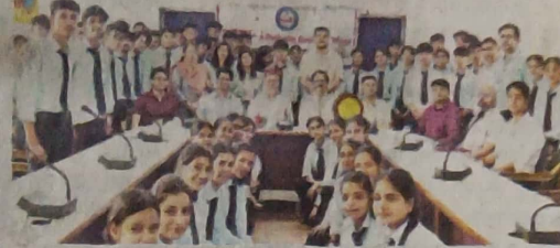
हिमाचल दस्तक • पालमपुर