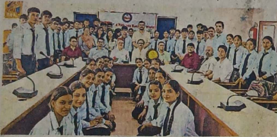
कैप्टन विक्रम बतरा महाविद्यालय में कार्यक्रम के समापन पर मौजूद विद्यार्थी