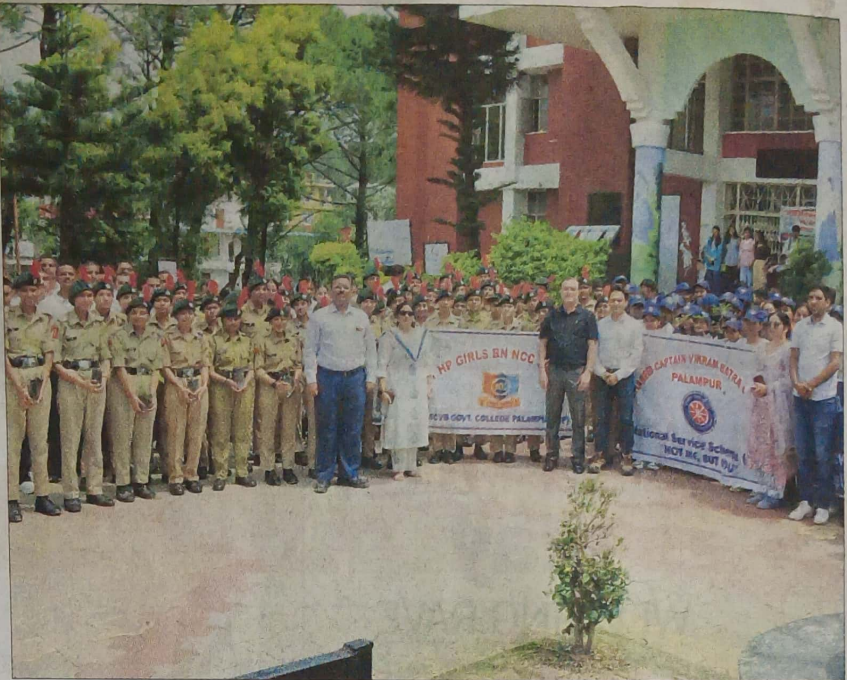
Tributes being paid to the martyrs of the Kargil War at Shaheed Capt Vikram Batra Govt College, Palampur.

The state lost hundreds of soldiers in the Kargil War and militancy operations. If one looks at the figures, Kangra, Hamirpur and Mandi districts have received the highest number of bodies. In the past 20 years, most of the attacks were reported from Jammu