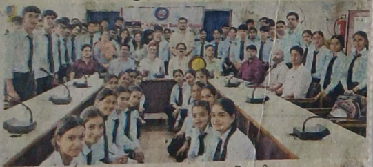
पालमपुर: कार्यक्रम के समापन अवसर पर प्रतिभागी।